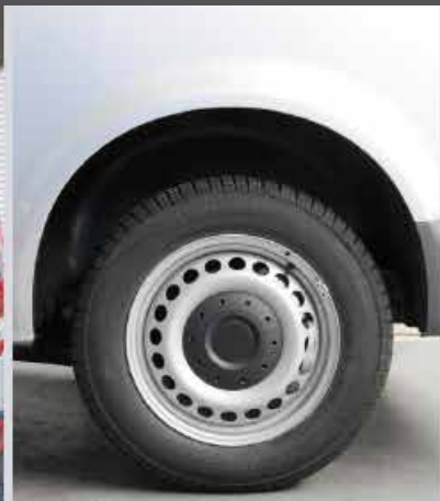
SOSPENSIONI PRONTE ALLA PARTENZA DEL VEICOLO, ALTEZZA STANDARD