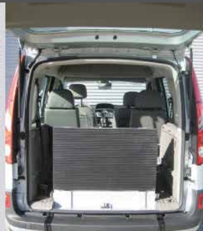
LA VISIBILITA' POSTERIORE E' MANTENUTA