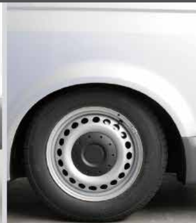
SOSPENSIONI PRONTE DURANTE L'ACCESSO DEI TRASPORTATI, ALTEZZA RIBASSATA

I kit AMF sono stati i primi in Europa e da sempre garantiscono massima affidabilità e sicurezza.