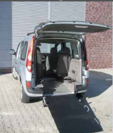
IL VEICOLO ABBASSATO RENDE UN ACCESSO FACILE, VELOCE E PROTETTO DALLE INTEMPERIE